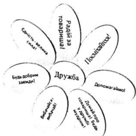
Квітка-семицвітка до слова

– Ось і зібрали ми «Квітку Дружби». Хай же цвіте вона і розквітає у ваших душах добротою і ласкою,